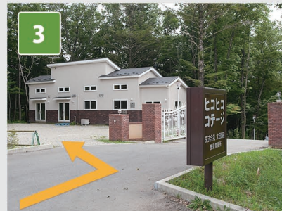
3 株式会社太田興産 那須営業所 こちらにて受付します。