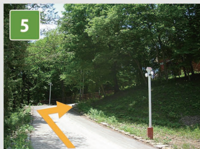
5 突き当りを右折し、 坂道を上がります。