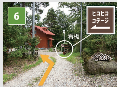
6 約70m先にあるこの看板の左側に ヒコヒココテージがあります。