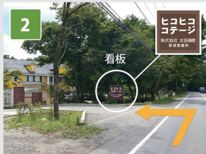
2 約700m先にヒコヒココテージの 看板がありますので左折します。