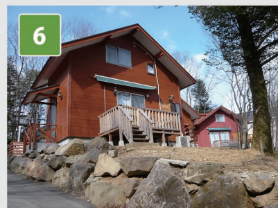
6 約60m先にヒコヒココテージが あります。