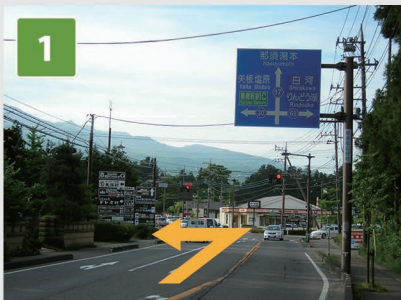
1 広谷地交差点を左折します。 (30号線へ)