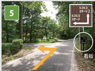
5 約110m先にある この看板で左折します。